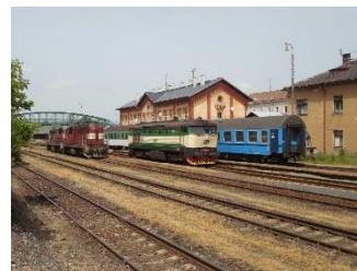
Vlakové nádraží (ŽST)

Zastávky Junior klub a Gymnázium jsou bez nástupiště, nástup je možný pouze na pokyn dopravce, prvními dveřmi ve směru jízdy vlaku.